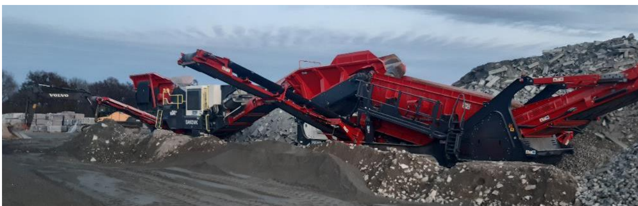
Concasseur EDYCEM PPL

Deux priorités pour 2021 : la maximisation de l'utilisation des sables manufacturés en substitution des sables naturels et le développement de la réutilisation des granulats issus du traitement des retours de béton BPE et des rebus béton de l'activité de préfabrication. À ce jour, plus de 10 000 tonnes de rebus de béton viennent d'être concassées par EDYCEM PPL. Elles sont réutilisées dans la production de l'usine suivant une proportion maximale de 10 % sans impact sur la qualité des produits finis. Ces démarches vont se poursuivre afin de contribuer pleinement à sauvegarder les ressources naturelles des territoires .